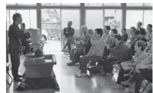
いきいきサロン活動