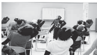
さわやか健康教室